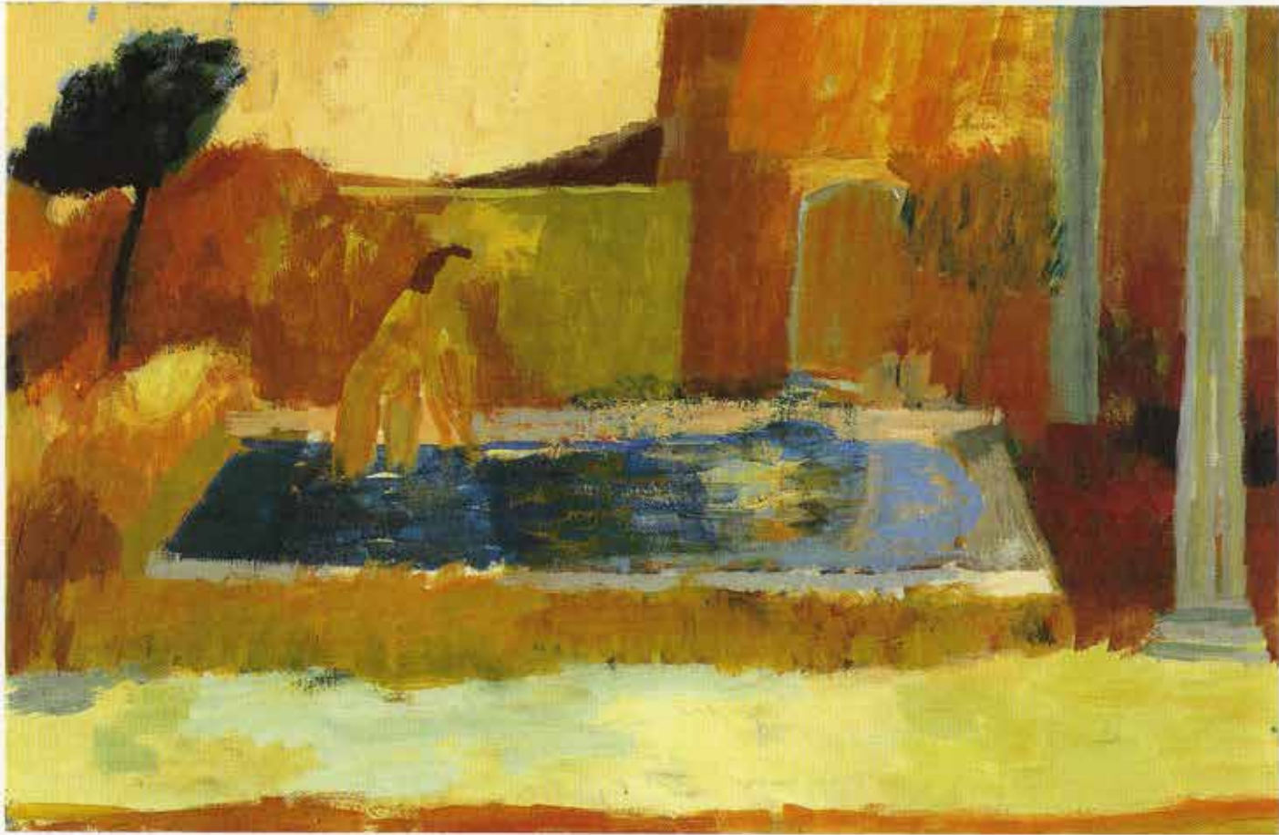
Susanna, 75 x 115 cm, 1997