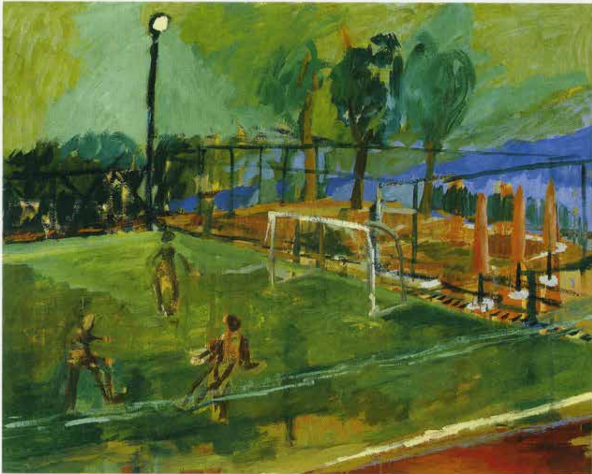
Calcio, 100 x 125 cm, 1997