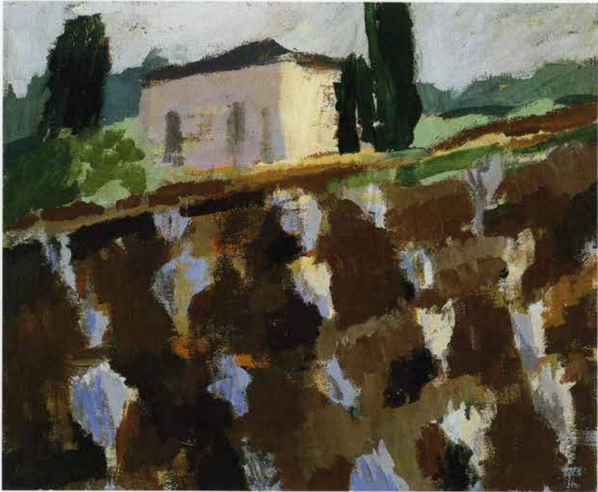
Toskana, 74 x 90 cm, 1999