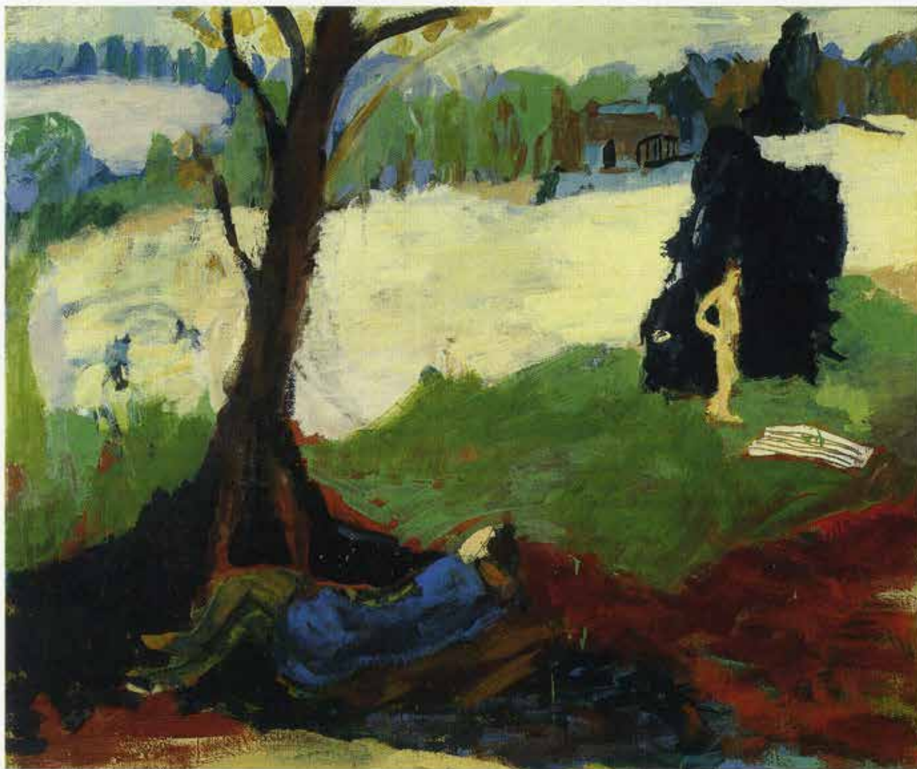
Ein Traum, 100 x 120 cm, 1998