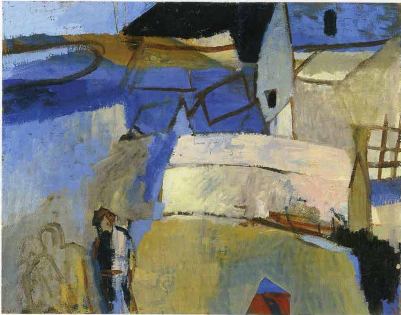
Das Dorf und die Maler, 80 x 100 cm, 1999