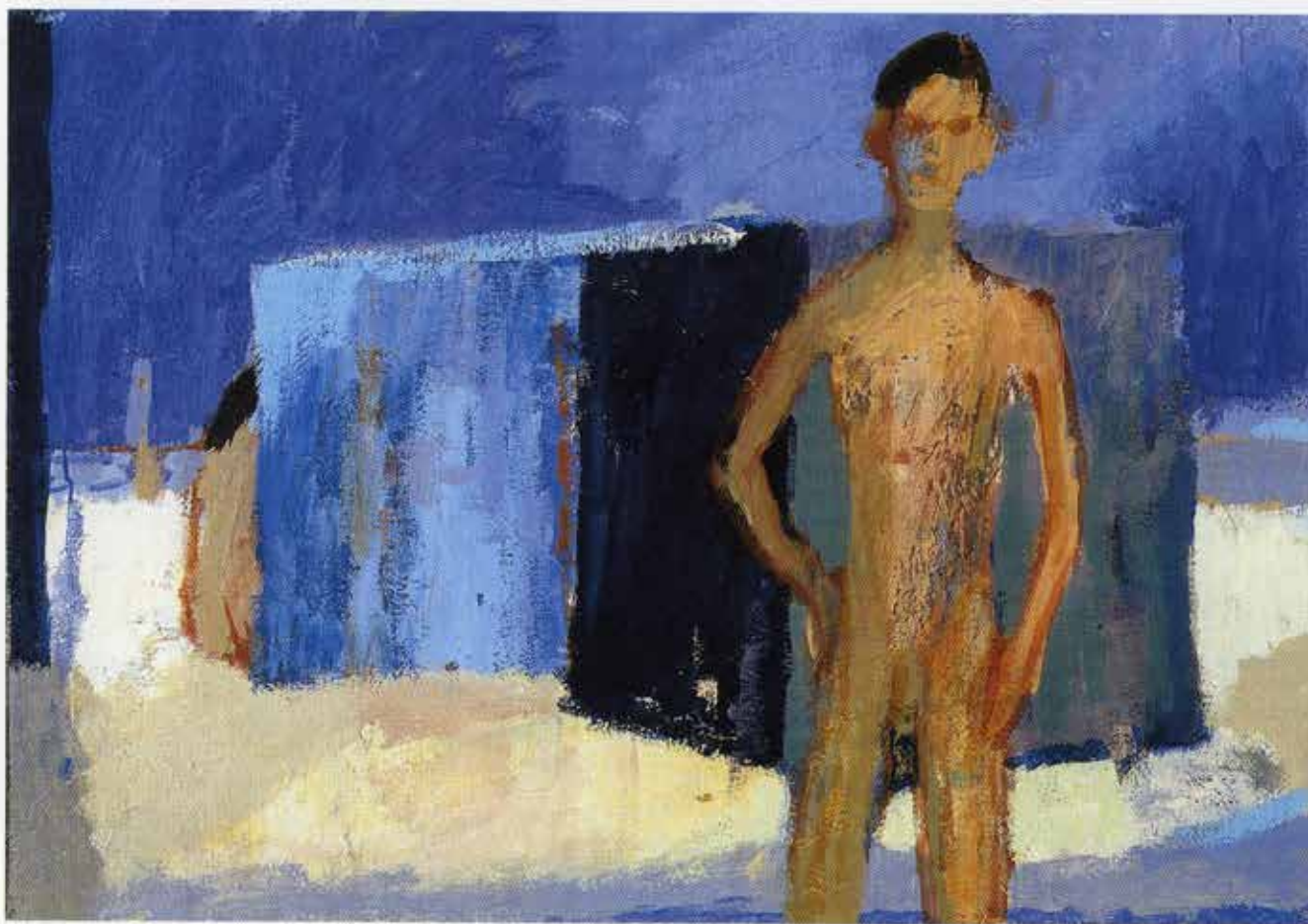
Bad Boy, 57 x 82 cm, 1998