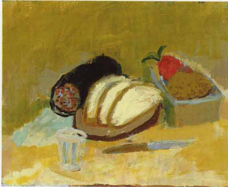
Vesper, 55 x 68 cm, 1999