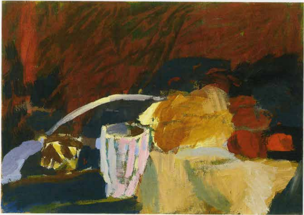
Stilleben in Rot, 55 x 78 cm, 1998