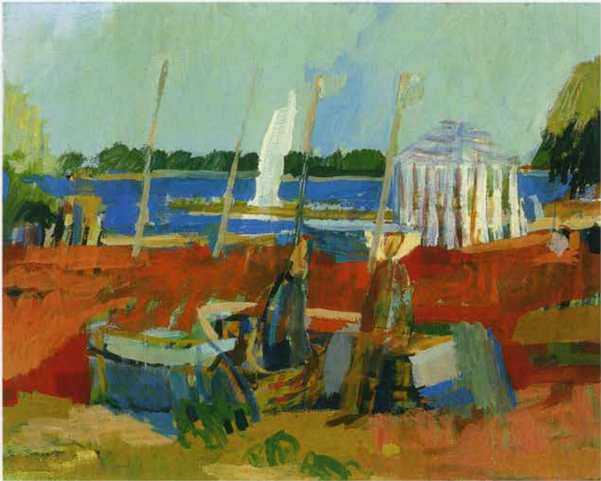
Happiness, 80 x 100 cm, 1997