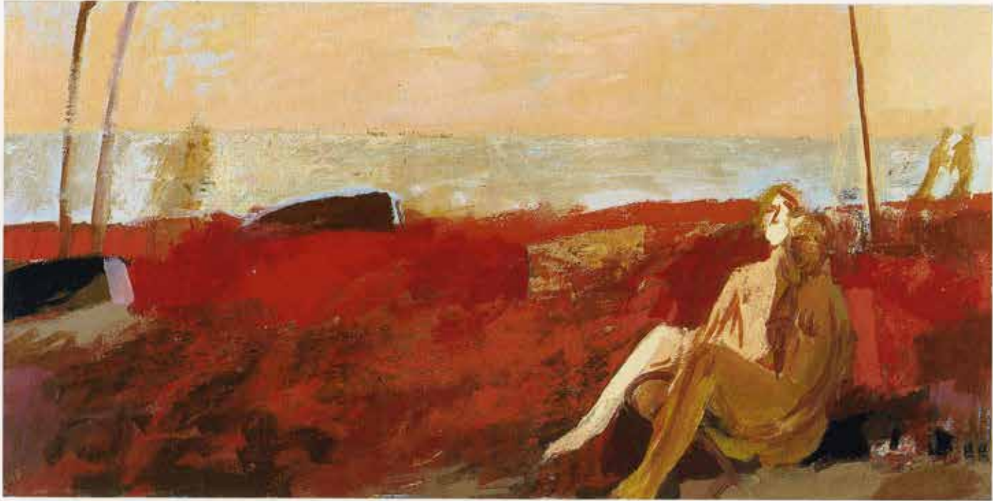
Abend/Rot, 62 x 125 cm, 2000