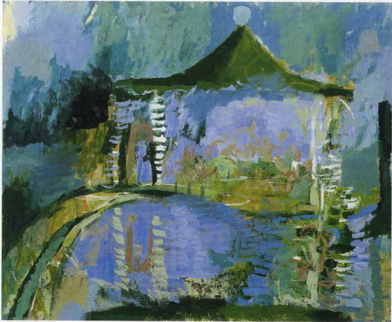
Wunderlich im Spiegelbilde, 115 x 140 cm, 1999