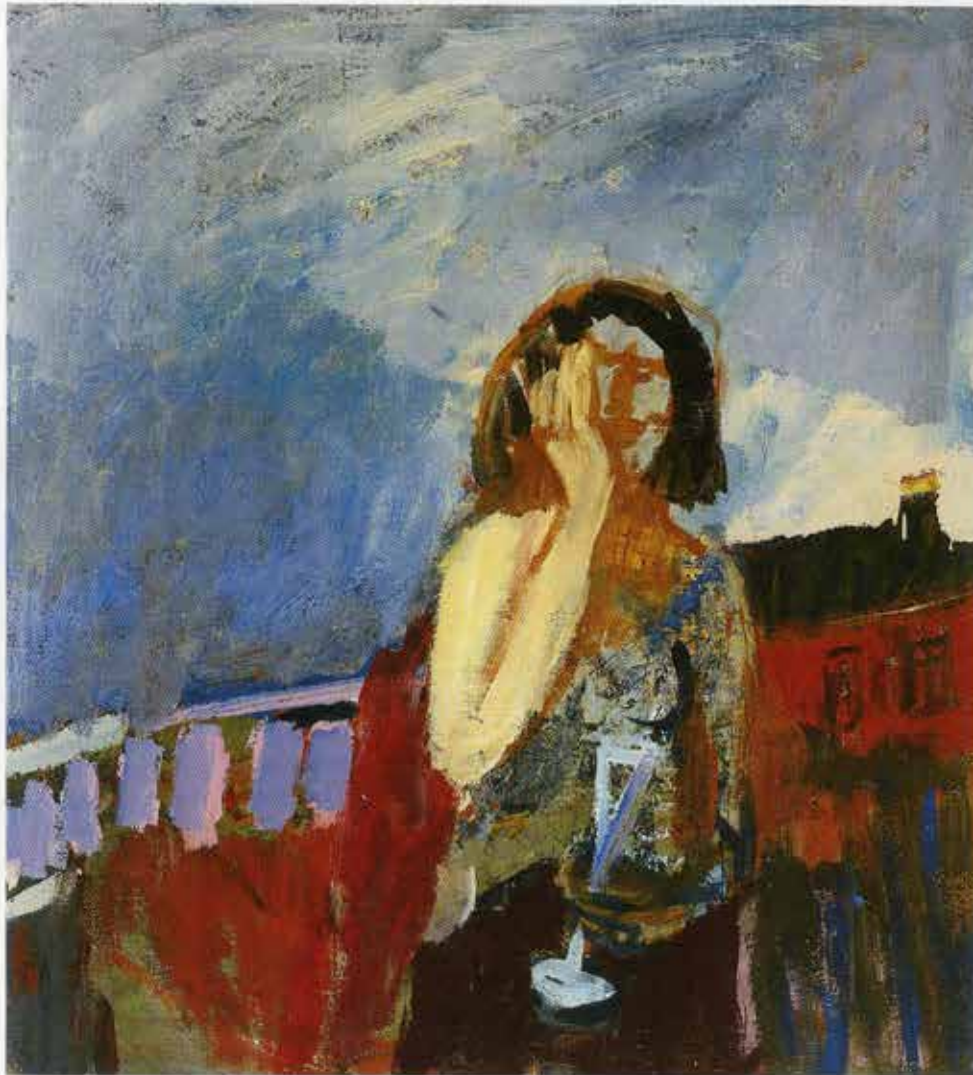
Die Nacht, 90 x 81 cm, 1998