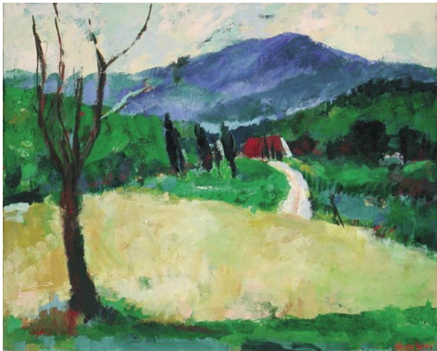
Schwarzwald, 80 x 99 cm, Öl auf Leinwand, 2004