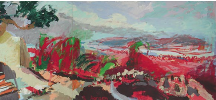
Löwenburg, 103 x 450 cm, dreiteilig, Eitempera auf Leinwand, 2002