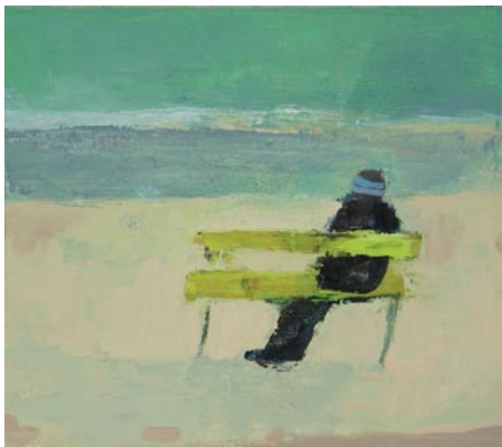
Die gelbe Bank, 45 x 50 cm, Öl auf Leinwand, 2004