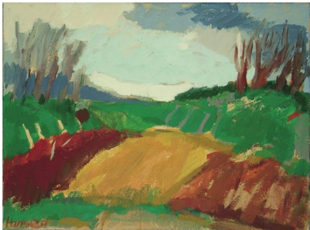
Voreifel, 61 x 80 cm, Eitempera auf Leinwand, 2002