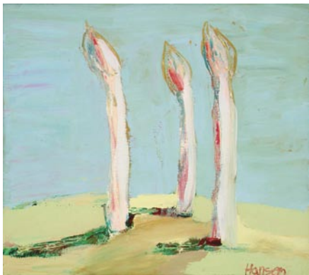
Spargel, 40 x 45 cm, Öl auf Leinwand, 2003