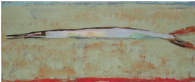
Hornhecht, 31 x 71 cm, Eitempera auf Leinwand, 2004