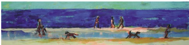
Strandläufer, 47 x 200 cm, Eitempera auf Leinwand, 2004