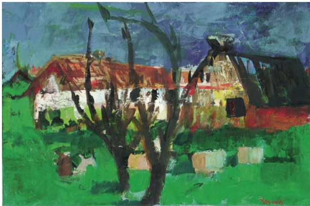
Das Haus von Darius, 48 x 73 cm, Öl auf Leinwand, 2004