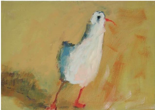
Die Möwe, 60 x 69 cm, Eitempera auf Leinwand, 2004